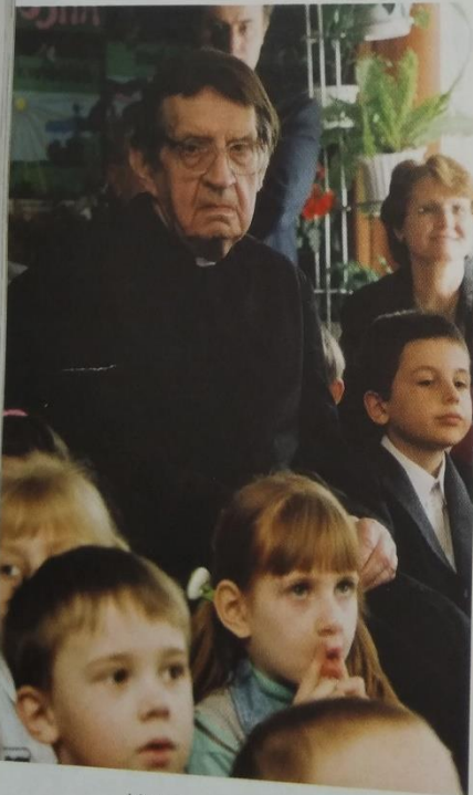
Ksiądz Jan Twardowski